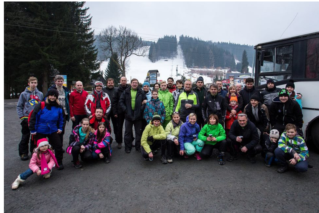
Lyžařský zájezd v Karlově pod Pradědem.